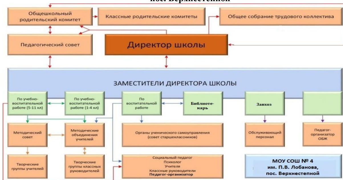
Схема управления МОУ СОШ № 4 им. П.В. Лобанова, пос. Верхнестепной

Вывод: Организация управления МОУ СОШ № 4 им. П.В. Лобанова, пос. Верхнестепной соответствует уставным требованиям. Данная структура управления школой позволяет эффективно осуществлять обратные связи, является компактной, составляющие структуры не дублируют функции друг друга, системно связаны по вертикали и горизонтали, организуя многочисленные обратные связи.